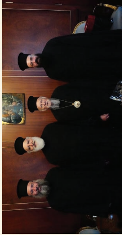
Συνοδική Ἀντιπροσωπεία στὰ Σεπτὰ Ἵνομαστήρια τῆς Α.Θ.Π. τοῦ Οἰκουμενικοῦ Πατριάρχου, κ.κ. Βαρθολομαίου (11-6-2023)