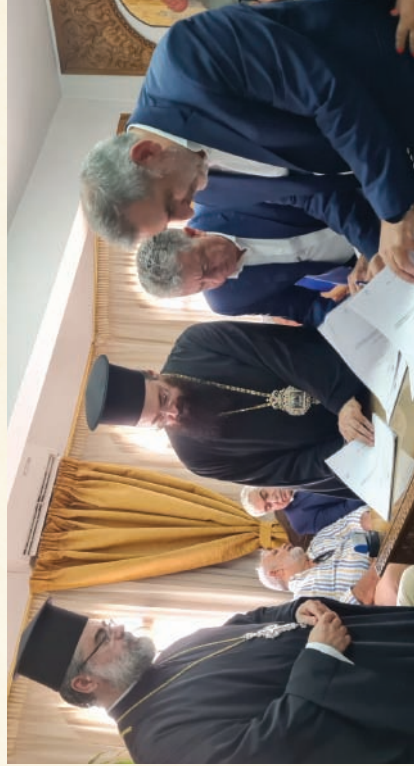
Υπογραφή προγραμματικής σύμβασης για την ανακαίνιση της Ίερας Μονής Κρουσταλλένιας (15-8-2023)