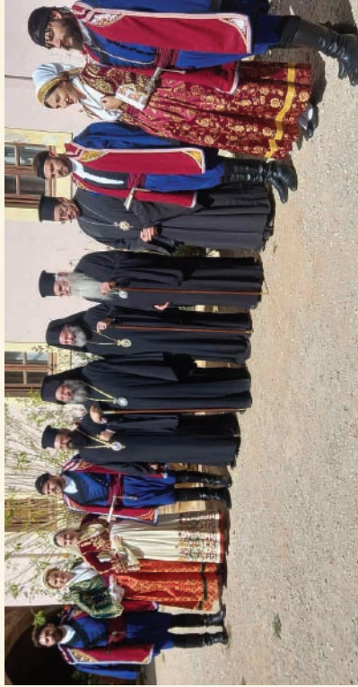
Α΄ Συνέδριο Βιοηθικής του Οικουμενικού Πατριάρχείου στην Ίερά Μητρόπολη Ρεθύμνης (20 έως 22-10-2023)