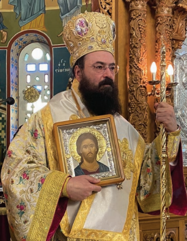
Ὁ Σεβασμιώτατος Μητροπολίτης Πάτρας καί Χερρονήσου κ. Γεράσιμος