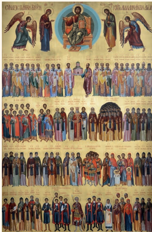
Ἡ εἰκὼν πάντων τῶν ἐν Κρήτῃ διαλαμφάντων Ἁγίων