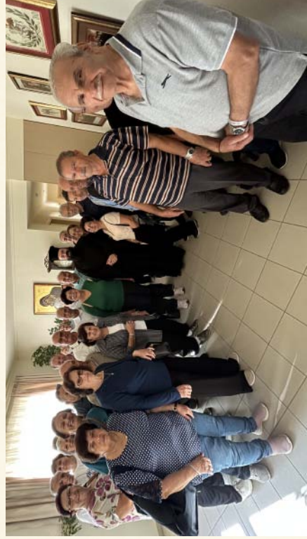
Έπίσκεψη Συλλόγου Έλληνοκυπρίων Άξιωματικών έ.ά. (24-10-2023)