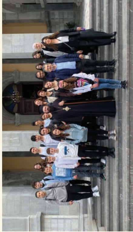
Μαθητές ἀπό τό Γυμνάσιο τοῦ Ἁγίου Δομετίου Κύπρου (25-3-2023)