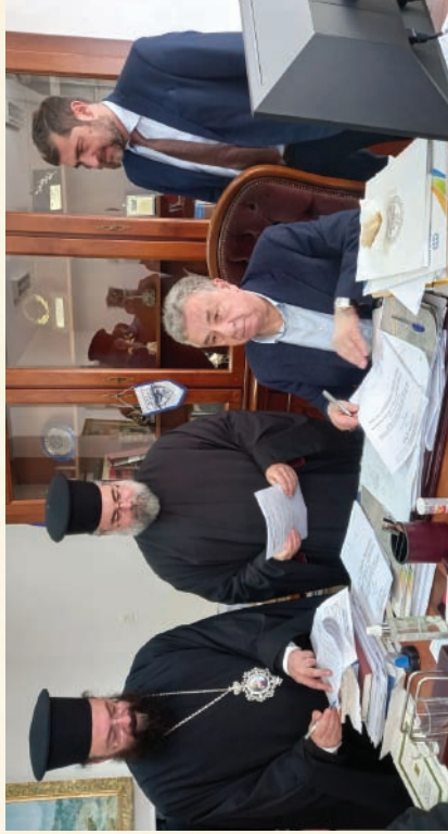
Υπογραφή Σύμβασης για τήν εξωτερική ανάκαίνιση του κτηρίου καί τόν εξοπλισμό του Φυσιοθεραπευτηρίου του Κ.Φ.Η. «Η Μεγάλη Παναγιά» (16-1-2023)