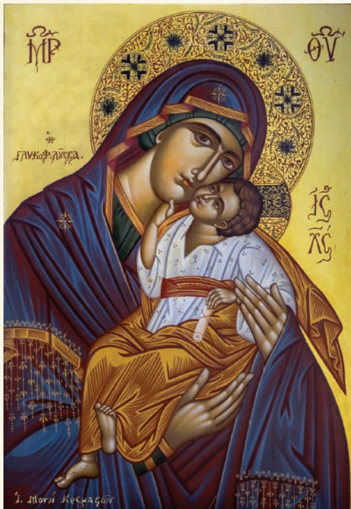
Ἡ Παναγία ἡ Γλυκοφιλοῦσα, ἔργον Ἱερᾶς Μονῆς Ταξιαρχῶν Κρεμαστῶν