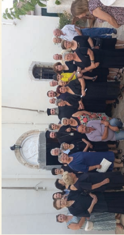
Ίερά Παράκληση στο χωριό Βουλισιμένη (1-8-2023)