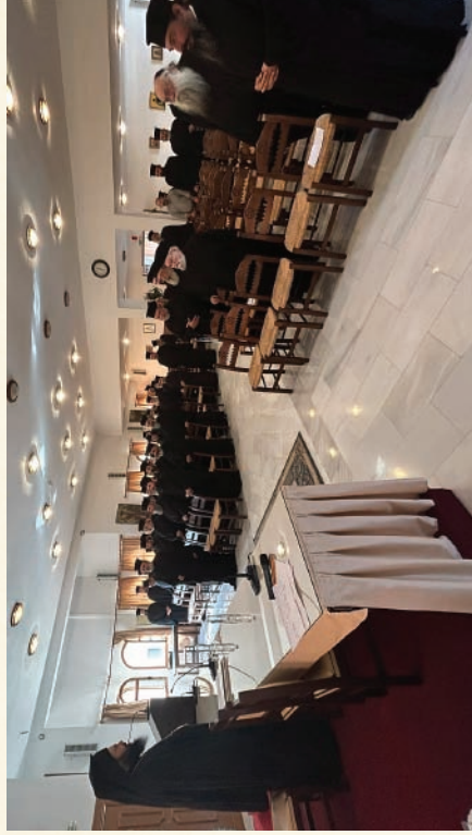
Τερατική Σύναξη (10-11-2023)