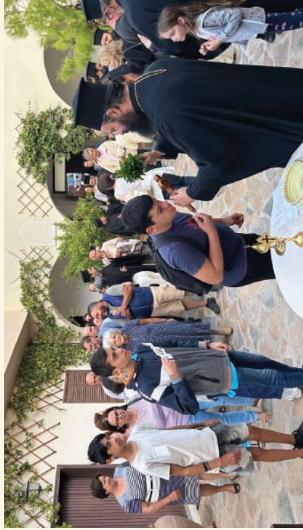
Ἁγιασμός τῶν Σχολῶν πῆς Ἱερᾶς Μητροπόλεως (2-10-2023)