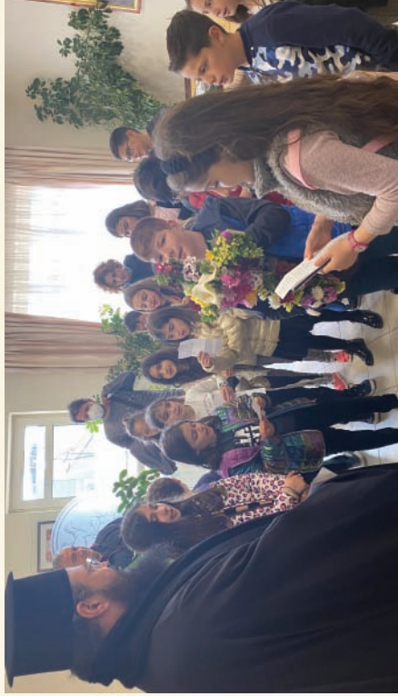
Μαθητές τῶν Σχολείων ψάλλοντες τὰ Κάλαντα τοῦ Λαζάρου (6-4-2023)