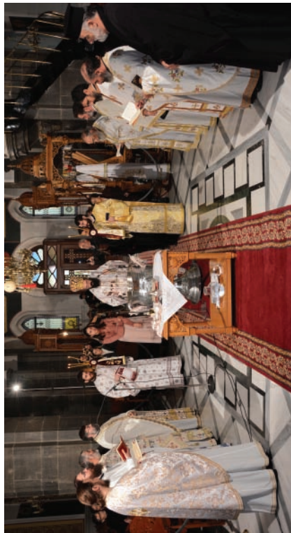
Ὁ Σεβ. Μητροπολίτης Πέτρας καί Χερρονήσου κ. Γεράσιμος, τελεῶν τό Ἱερόν Μυστήριο τοῦ Βαπτίσματος, κατά τήν Θεϊάν Λειτουργίαν

Ἀκολουθεῖ ὁ Μεγάλος Ἁγιασμός τῶν Ὑδάτων. Εἶναι ὁ ἴδιος Ἁγιασμός πού τελεῖται κατά τήν ἐορτή τῶν Θεοφανείων, διότι ὁ χριστιανός βαπτίζεται στά