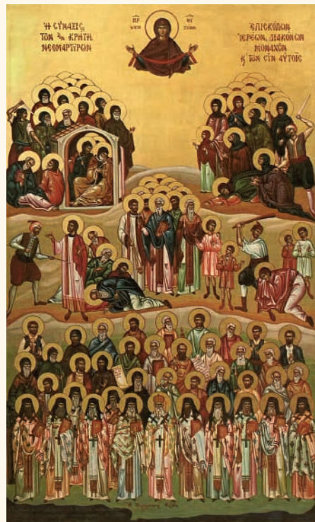
Ἡ Σύναξις τῶν ἐν Κρήτῃ Νεομαρτύρων