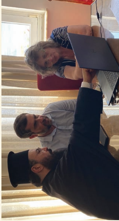
Συνάντηση στήν Άντιπεριφέρεια Λασιθίου γιά τά ἐκκλησιαστικά ἔργα. (2-6-2023)