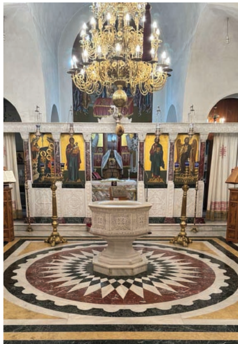
Τό Βαπτιστήριο τῆς Τερᾶς Μονῆς Ἁγίου Γεωργίου Σεληνάρι

Ἐπειτα ὁ κατηχούμενος ἀλείφεται σέ ὅλο τό σῶμα μέ τό Ἅγιο Ἐλαιό, ὡς προοίμιο τοῦ Ἁγίου Μύρου μέ τό ὁποῖο θά χριστεῖ μετά τή Βάπτισμα. Στήν ἀρχαιότητα, οἱ ἀγωνιστές στό στάδιο ἀλείφονταν μέ λάδι σέ ὅλο τό σῶμα γιά ἐνδυνάμωση καί προκειμένου, μέ τό ἐπάληψη τοῦ λαδιοῦ, νά ἐμποδίζεται ὁ ἐχθρός νά τοὺς πιάσει. Αὐτό συμβολίζει ἡ ὁλόσωμη χρίση τοῦ κατηχουμένου μέ τό Ἅγιο Ἐλαιό, τό ὁποῖο εἶναι «ἔπλον δικαιοσύνης», πού ἀποτρέπει κάθε «διαβολική ἐνέργεια» 17 . Γιά τοῦτο, λέει ὁ Ἱερός Χρυσόστομος, οἱ ἀθλητές τοῦ Χριστοῦ εἰσέρχονται στο πνευματικό στάδιο διά τοῦ Ἐλαιίου 18 .