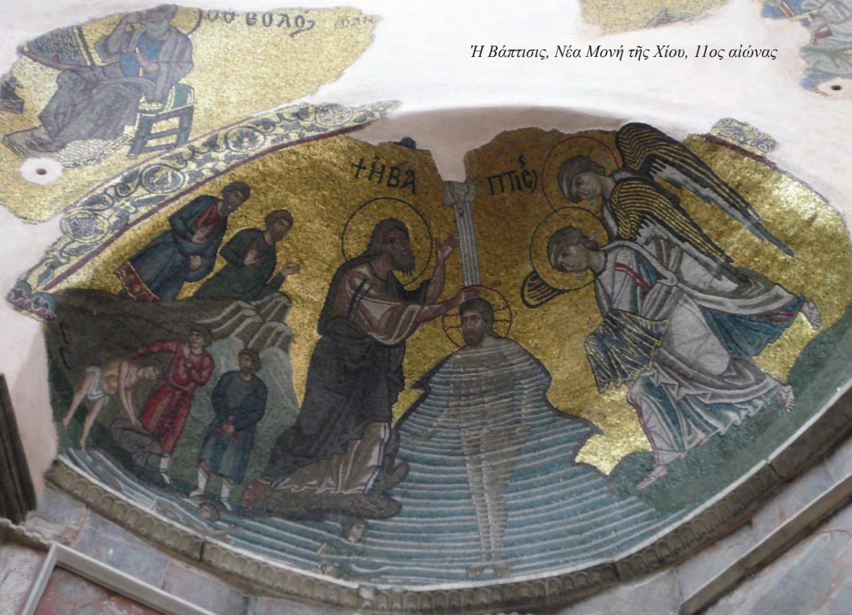
Ἡ Βάπτισις, Νέα Μονή τῆς Χίου, 11ος αἰώνας