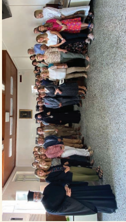
Ἁγιασμός στό Δικαστικό Μέγαρο Νεαπόλεως (8-10-2023)