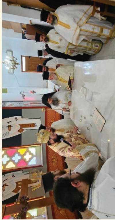
Ἐγκαίνια Ἱεροῦ Ναοῦ Ἀγίων Κωνσταντίνου καὶ Ἑλένης, Ἐνορίας Σισίου (6-5-2023)