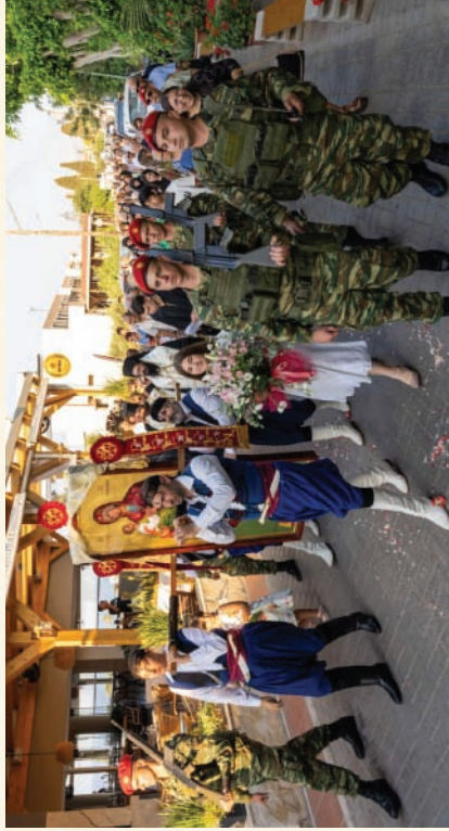
Υποδογή Ἱερᾶς Εἰκόνης Παναγίας “Κυρᾶς Ἐλεούσης” (Ἐπισκοπιανῆς) στὴν Ἐνορία Πισκοπιανοῦ Χερσονήσου (13-7-2023)