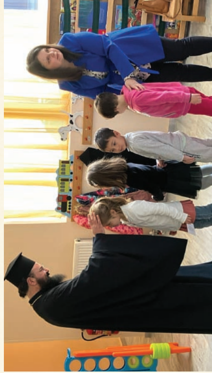
Εγκαίνια παιδότοπου του β' Νηπιαγωγείου Νεαπόλεως (13-3-2023)