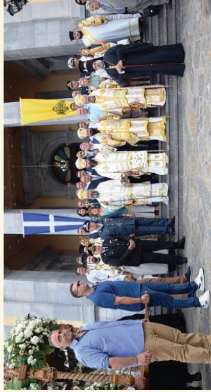
Πανήγυρις Ίερού Μητροπολιτικού Ναού Μεγάλης Παναγίας Νεαπόλεως (15-8-2023)