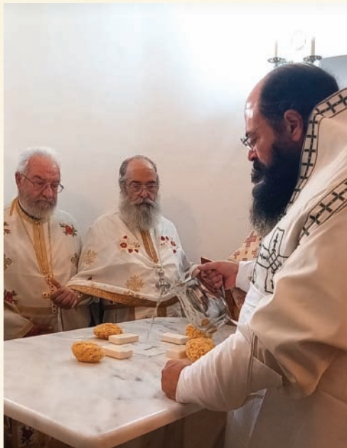
Ἐγκαίνια Ἱεροῦ Ναοῦ Ὁσίας Εἰρήνης Χρυσοβαλάντου Ἐνορίας Μαλιῶν (14-10-2023)