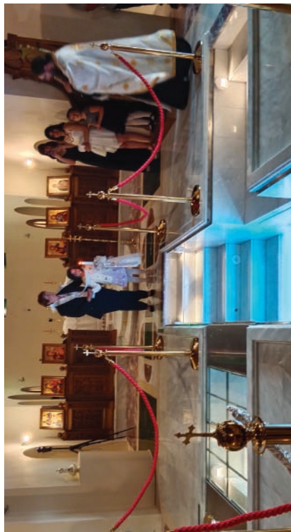
Στιγμιότυπο ἀπό τήν τέλεση Βαπτίσεως στό νεόδομητο βαπτιστήριο τοῦ Ἱεροῦ Ναοῦ Ἐυαγγελιστρίας, πόλεως Ἁγίου Νικολάου

Στή συνέχεια, ο ιερέυς, επιθέτοντας τό χέρι του στό κεφάλι τοῦ κατηχομένου, τόν βαπτίζει ὀλόσωμο στήν κολυμβήθρα ἐκφωνώντας: «Βαπτίζεται ὁ δοῦλος τοῦ Θεοῦ [τό ὄνομά του] εἰς τό ὄνομα τοῦ Πατρὸς (μία κατάδυση καί ἀνάδυση) καί τοῦ Υἱοῦ (δεύτερη) καί τοῦ Ἁγίου Πνεύματος (τρίτη). Ἀμήν». Ὅπως εἶδαμε, ἡ κολυμβήθρα συμβολίζει τόν Πανάγιο Τάφο τοῦ Χριστοῦ, οἱ τρεῖς καταδύσεις καί ἀναδύσεις τήν τριήμερο Ταφή καί τήν Ἀνάσταση 19 . Στήν Ὁρθόδοξη Λατρεία, τά σύμβολα δέν εἶναι ἀπλές ἐνθυμίσεις κάποιων γεγονότων, ἀλλά ταυτίζονται πνευματικά μέ τό συμβολιζόμενο. Γι' αὐτόν τόν λόγο, ἡ ὀλόσωμη τριπλή κατάδυση στό ἁγιασμένο ὕδωρ εἶναι ἀναγκαῖο στοιχεῖο γιά τήν τελετή τοῦ Μυστηρίου 20 . Ὅπως ἔγραφε ὁ μακαριστός μητροπολίτης Διοκλείας Κάλλιστας Ware: «Καί ἂν ἀκόμη μερικοί Ὁρθόδοξοι κληρικοί εἶναι ἀπρόσεκτοι ὡς πρός τή σωστή ἐφαρμογή τοῦ τυπικοῦ, δέν ὑπάρχει καμιά ἀμφιβολία σχετικά μέ τήν ἀληθινή Ὁρθόδοξη διδασκαλία: ἡ κατάδυση εἶναι ἀπαραίτητη (ἐκτός ἀπό ἔκτακτες περιπτώσεις), ἐπειδή ἂν δέν ὑπάρξει κατάδυση, τότε χάνεται ἡ ἀντιστοιχία μεταξύ ἐξωτερικοῦ καί ἐσωτερικοῦ νοήματος καί