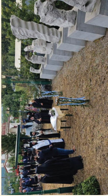
Ἐπέτειος τῆς Μάχης τοῦ Λασιθίου (29-5-2023)