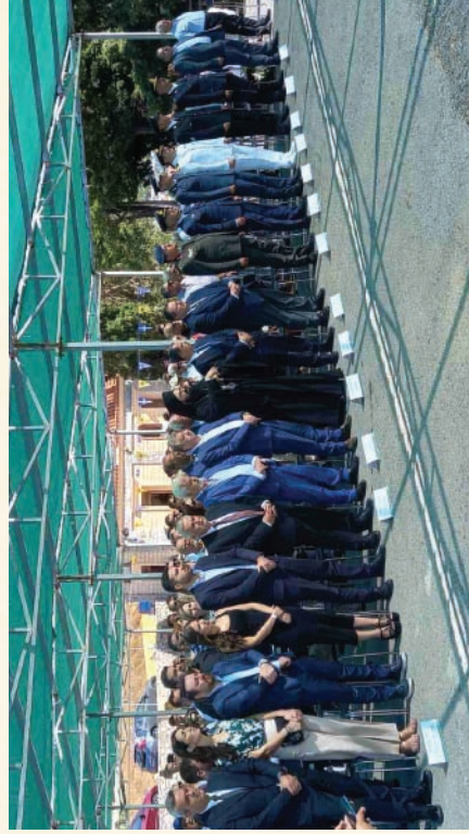
Έπέτειος του Όλοκαυτώματος της Έπαρχίας Βιάννου (10-9-2023)