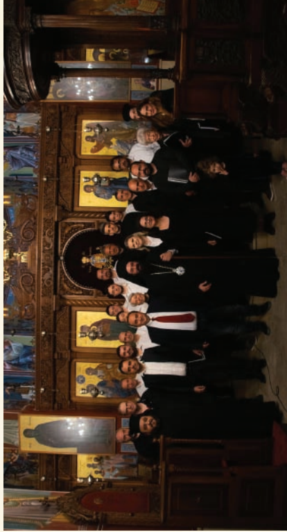
Μουσική Έκδηλωση καί άπονομή Πτυχίων καί Διπλωμάτων, τῆς Σχολῆς Βυζαντινῆς Μουσικῆς, τῆς Ἱερᾶς Μητροπόλεως (18-3-2023)