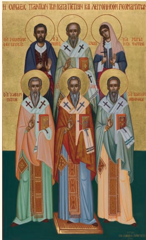
Ἡ Συναξίς τῶν ἐν τῇ Ἱερᾷ Μητροπόλει Πέτρας καί Χερρονήσου Ἁγίων Νεομαρτύρων. Ἔργον τῆς Ἱερᾶς Μονῆς Παναγίας Κουφῆς Πέτρας, 2021.

2018 (2-4 Ὀκτωβρίου) Ὁ Οἰκουμενικὸς Πατριάρχης Βαρθολομαῖος ἐπισκέπτεται τὴν Κρήτην καὶ προεξάρχει εἰς τὰς ἐορταστικὰς ἐκδηλώσεις 50ετίας τῆς Ὁρθοδόξου Ἀκαδημίας Κρήτης, ἀπὸ τῆς ἰδρύσεώς της.