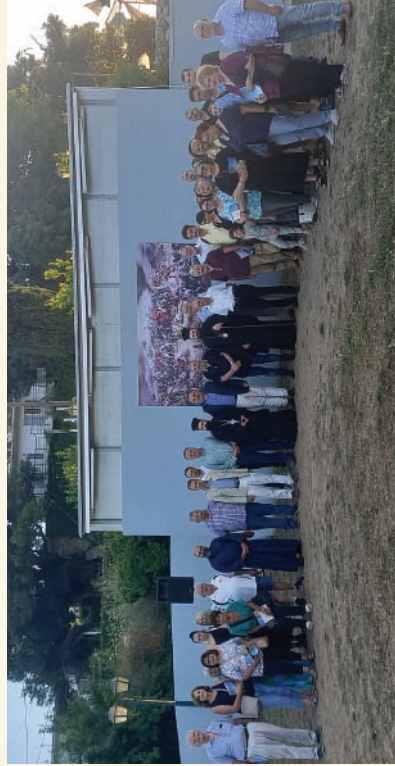
Τὰ Μέλη τοῦ βου Παγκοσμίου Συμβουλίου Κρητῶν στὴν Ἱερὰ Μονή Κρουσταλλένιας (19 ἔως 20-7-2023)