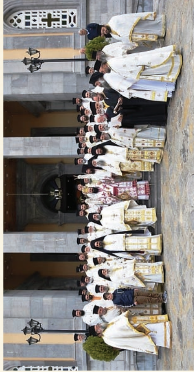
Ὁ Σεβασμιώτατος μετὸν Ἱερό Κλήρο τῆς Μητροπόλεως, στὰ Προπύλαια τοῦ Ἱεροῦ Μητροπολιτικοῦ Ναοῦ τῆς Μεγάλης Παναγίας Νεαπόλεως (Πάσχα 2023)