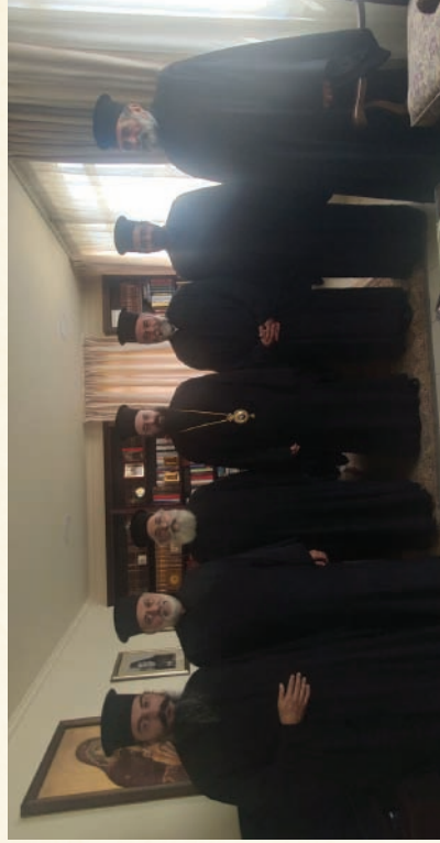
Τό νέο Διοικητικό Συμβούλιο τοῦ Συνδέσμου Κληρικῶν τῆς Ἱερᾶς Μητροπόλεως (6-7-2023)