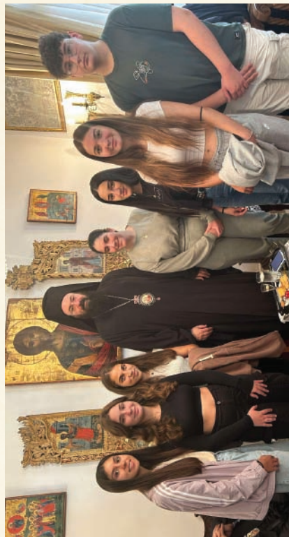
Ὁ Σεβασμιώτατος μέ τή μαθητιώσα νεολαία τῆς Νεαπόλεως κατά τήν ἡμέρα τῶν ὀνομαστηρίων του (20-10-2023)